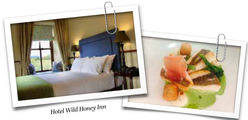
Hotel Wild Honey Inn