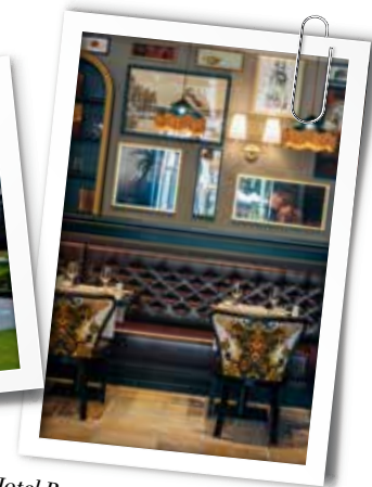
Hotel Rotary MGallery Collection