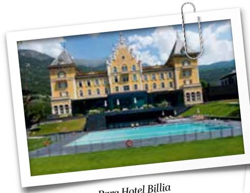
Parc Hotel Billia