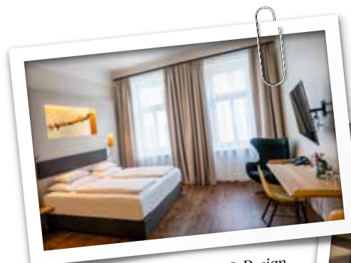
Hotel Rathaus Wein & Design